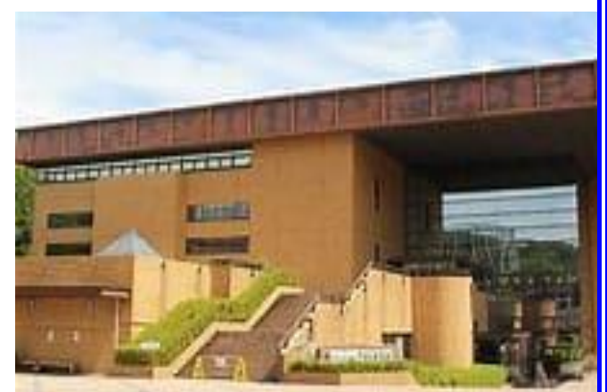
【 感謝と挑戦のTYK体育館 】