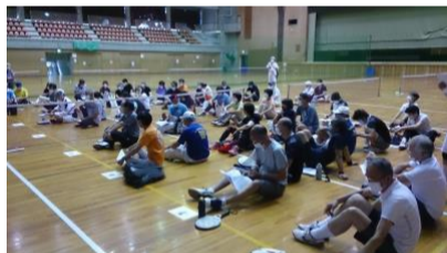
「開会式はマスク着用で行いました」

原則60歳以上の方優先で個人エントリーいただいた申込者を7人×8チーム(運営役員を含め合計参加者約60名)で各地区混在したチームに編成して対戦を行いました。熱戦が繰り広げられ、残り1チームの対戦を残し時間切れとなりましたが、久しぶりの大会で様々な地区の方々との懇親が図られました。