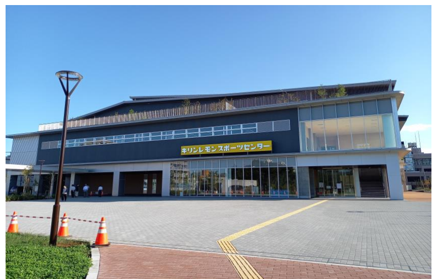
【 中野区麒麟レモンスポーツセンター 】