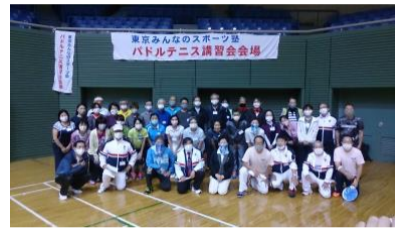
「マスク着用で記念撮影」

10月25日(日)に駒沢オリンピック公園体育館にて開催されました。本事業は、「パドルテニスをはじめとするニュースポーツの講習を実施することで、指導者を養成し、都民がスポーツに親しむ機会を創出すること」を事業目的としています。講習会には多数の参加者があり、2つのコースに分かれ、日本パドルテニス協会公認指導員による球出し方法などの指導技術や教室運営のヒントなどを実際に体験受講していただきました。