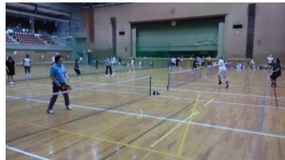
「色々な地区の方とペアで対戦」