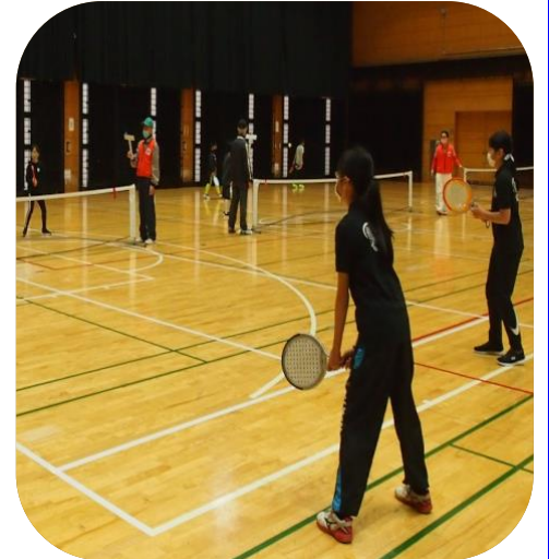
〈 ジュニアダブルスの試合 〉