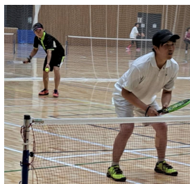
一般男子A優勝ペア

また、今回の記念大会の目玉として、大抽選会が開かれました。ラケットやボール、クーラーバックなど豪華景品が当たりました。