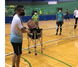
B コーチ養成コース