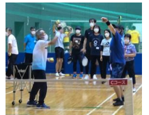
C 指導者を目指すコース