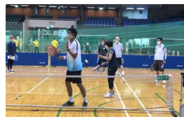
A チーフコーチ養成コース