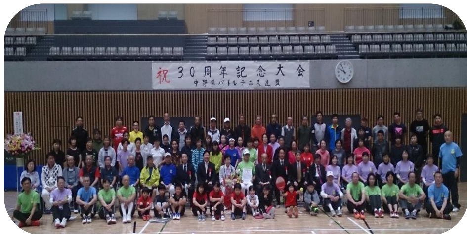
〈 皆さん笑顔で記念撮影 〉